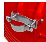
Soporte a poste (incluido)