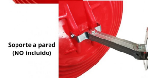
Soporte a pared (NO incluido)

*SI SE NECESITA SOPORTE PARA PARED, HAY QUE INCLUIR LA REFERENCIA 930.S